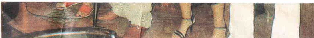
Público de Os Condes, durante una actuación de 'karaoke'.

El local también avanza con las nuevas tecnologías. En su página 'www.oscondes.com', disponen de una 'webcam' en vivo, que mediante el programa de reproducción RealOne, les permite emitir todas las actuaciones en directo, y no es ninguna sorpresa que les pidan canciones desde cualquier punto del planeta, desde Los Ángeles (Estados Unidos), Buenos Aires, Caracas o Uruguay, o desde la propia Península, como Alicante o Asturias, donde tienen muchos fans.