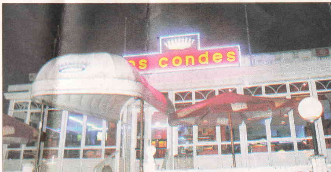
Vista exterior del establecimiento.